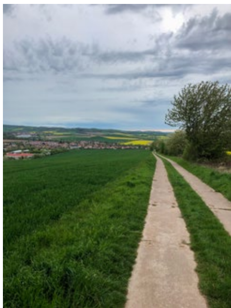
Blick auf Wehnde