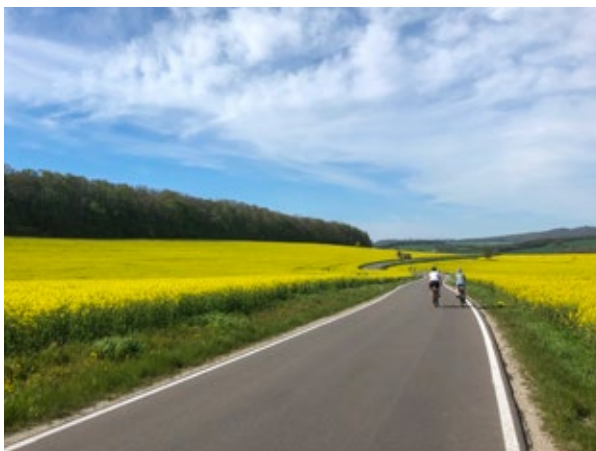
Zwischen Oberstein und Arenshausen