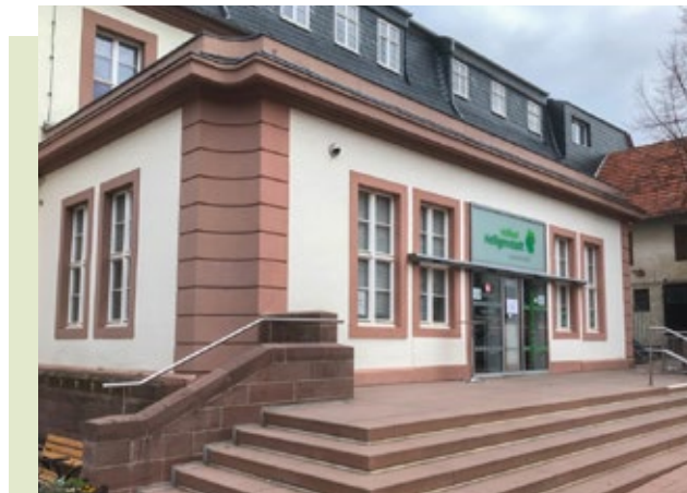
Tourist Info Heilbad Heiligenstadt