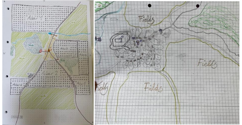
Selbstgemalte Pläne von zwei Dörfern

In diesem Projekt wird mit viel Spaß eine wirtschaftliche Simulation des Mittelalters umgesetzt. Es gibt einen Plan der Provinz Arfon, von der alle Schüler und Schülerinnen jeweils ein Dorf zugeteilt bekommen haben, zu dem sie sich selbst noch einen Plan aufgemalt haben. Sie spielen Adelige aus ihrem Dorf die gemeinsam die Provinz Arfon verwalten müssen, aber auch Events wie z.B. Turniere müssen geplant werden.