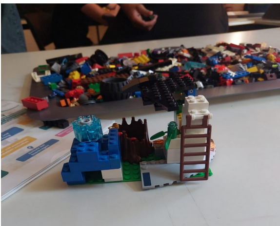
„So nachhaltig wie möglich“ mit diesem Gedanken haben die Schülerinnen und Schüler ihre Lego Modelle gebaut.

Das Projekt nimmt bei einem Wettbewerb zum Thema „nachhaltige Schulhofplanung“ teil und die Stadt Göttingen wird sich die Ideen der Schüler*innen angucken. Das Ziel ist es, dass die Stadt Göttingen einen Plan für einen nachhaltigen Schulhof umsetzen möchte.